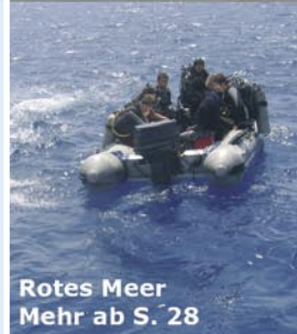
Rotes Meer Mehr ab S. 28