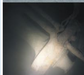
Bodensee Mehr auf S. 31